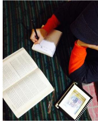
طريقة مواجهة الامتحان (تلخيص المواد الدراسية)