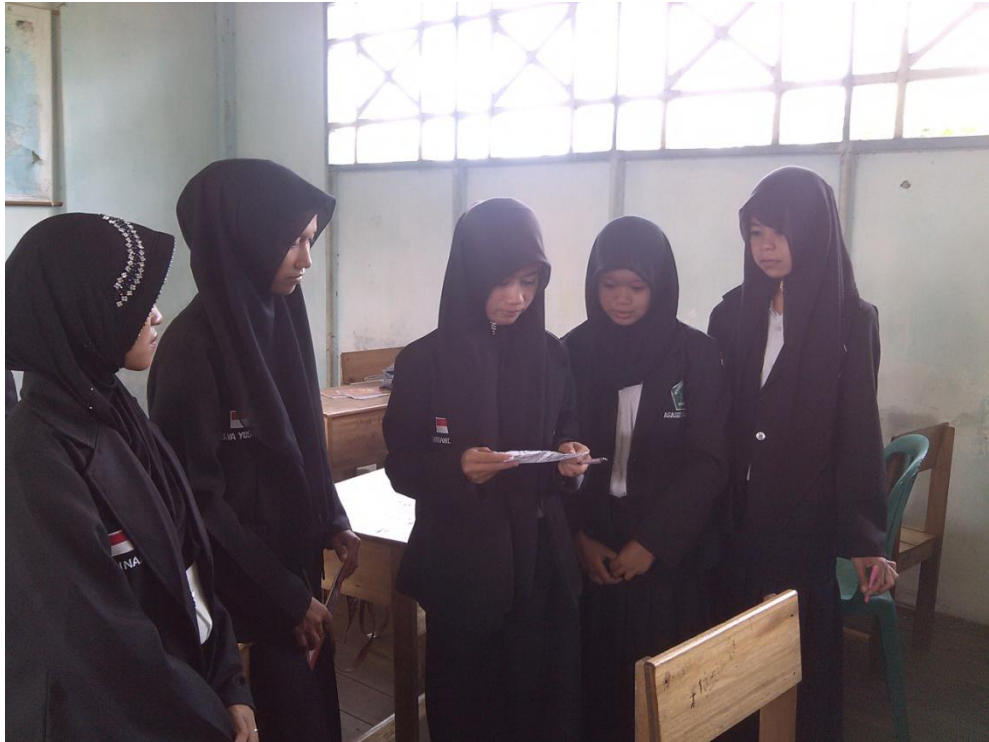
Gambar. 5 Foto observasi pada hari senin 23 Nopember 2015