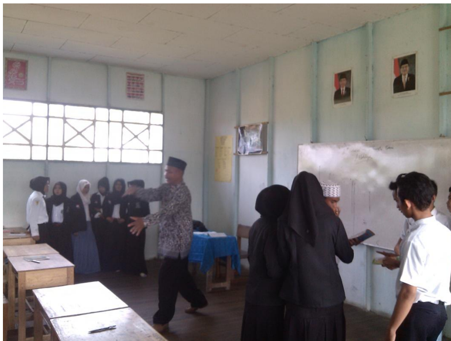
Gambar. 2 Foto observasi pada hari senin 23 Nopember 2015