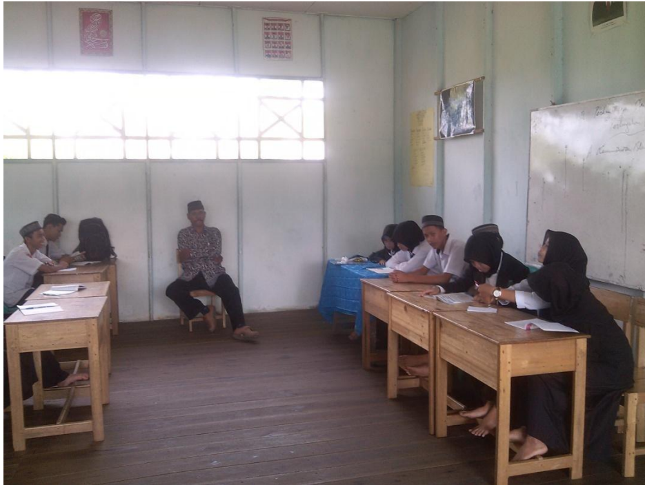
Gambar. 9 Foto observasi pada hari senin 30 Nopember 2015