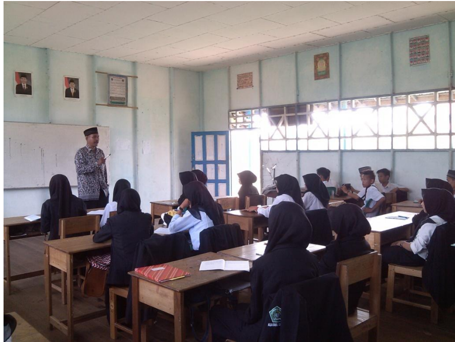
Gambar. 1 Foto observasi pada hari senin 23 Nopember 2015