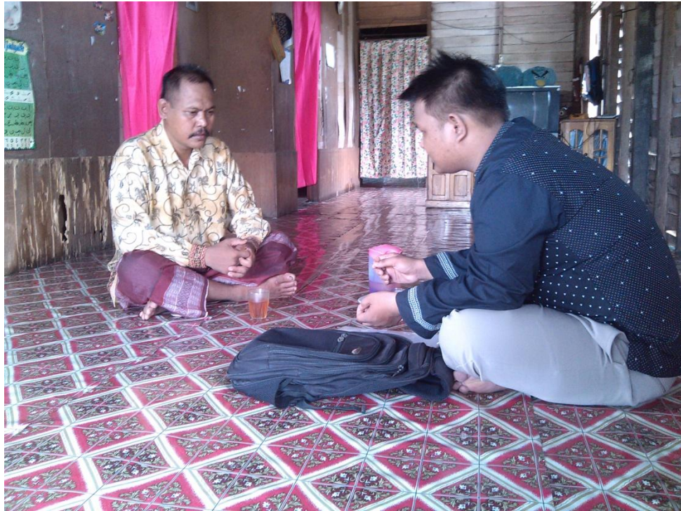
Gambar. 11 Foto wawancara dengan guru mata pelajaran SKI pada hari Jum'at 04 Desember 2015