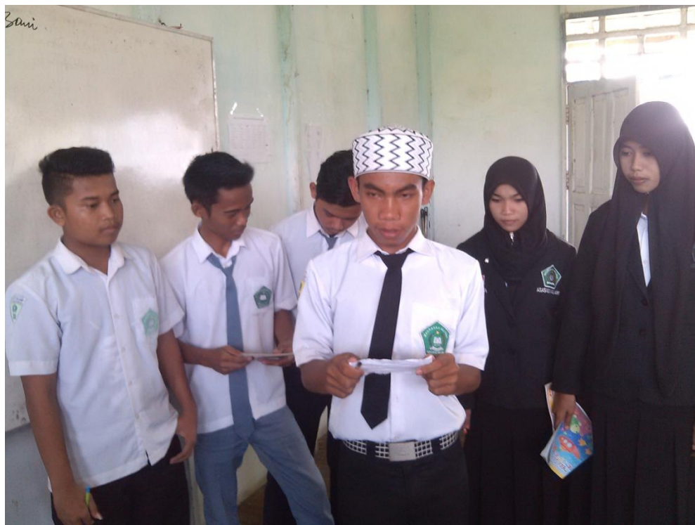
Gambar. 7 Foto observasi pada hari senin 23 Nopember 2015