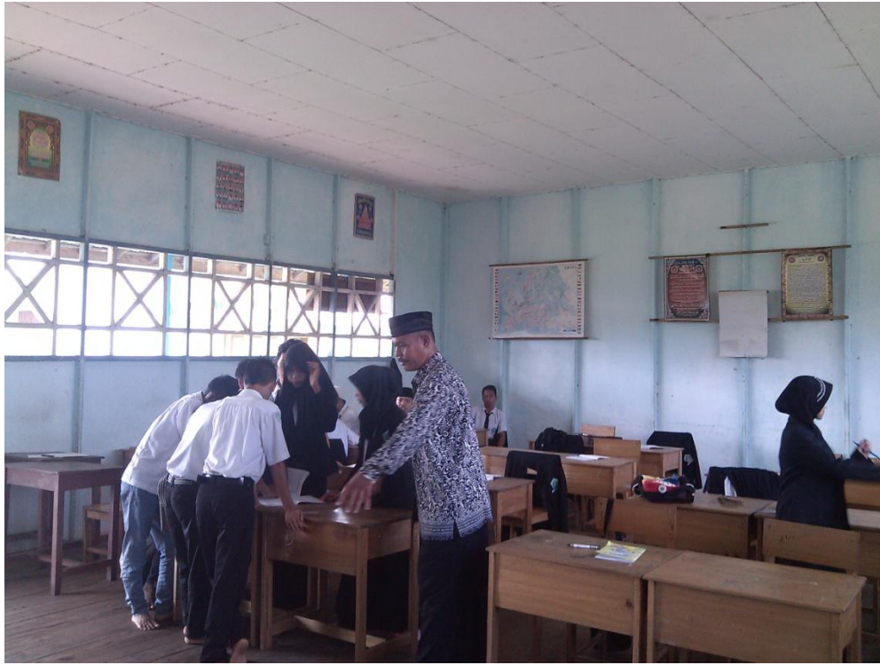
Gambar. 3 Foto observasi pada hari senin 23 Nopember 2015