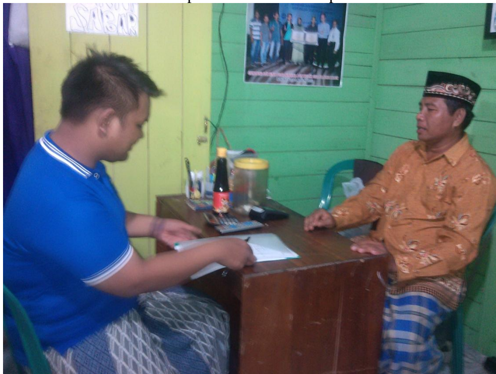
Gambar. 10 Foto wawancara dengan Kepala Sekolah Madrasah Aliyah Asasus Salam pada hari senin 14 Desember 2015