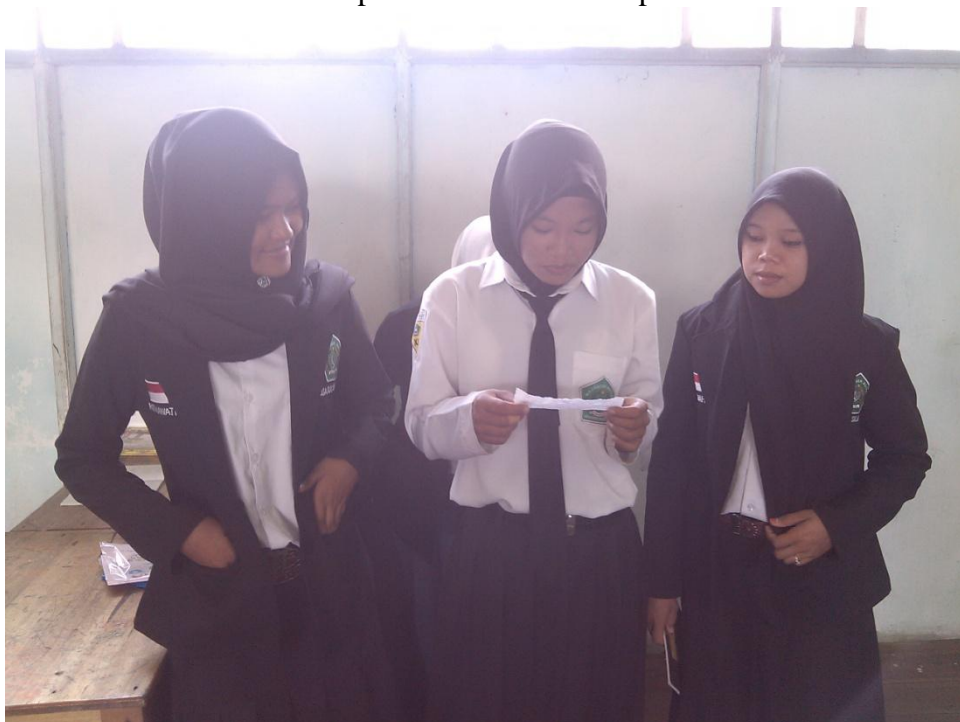
Gambar. 6 Foto observasi pada hari senin 23 Nopember 2015