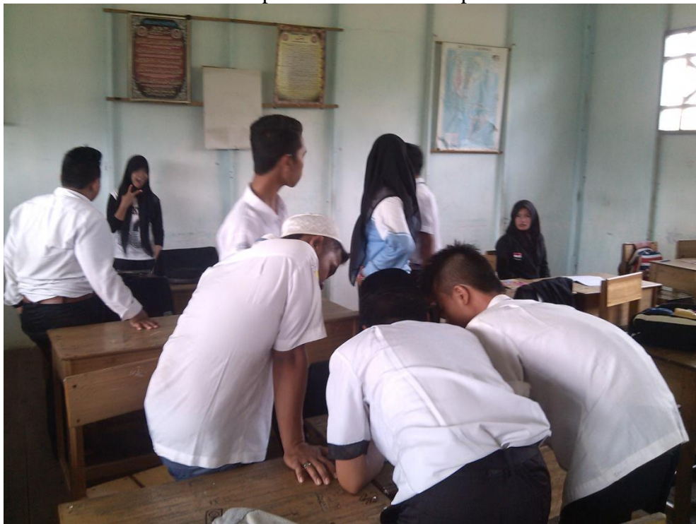
Gambar. 4 Foto observasi pada hari senin 23 Nopember 2015