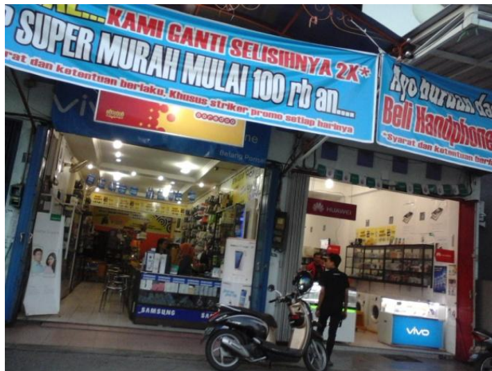
Tampilan depan Betang Cellular