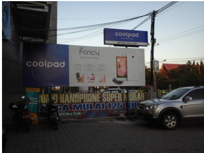
Tempat parkir Betang Cellular