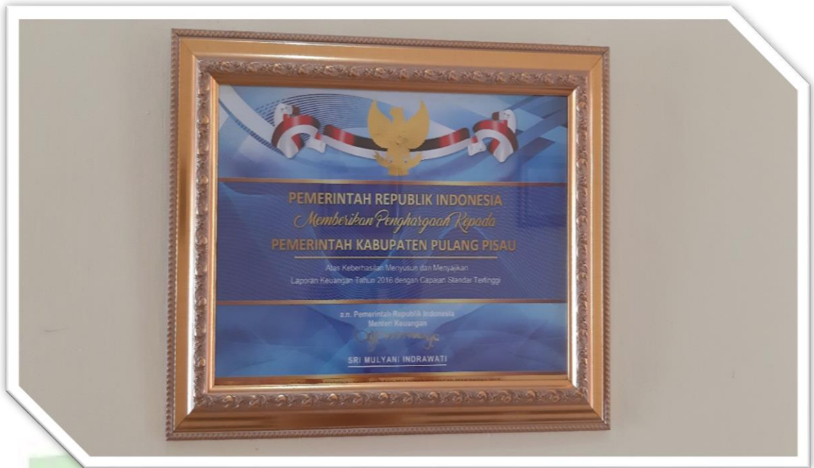
Foto 10 : Foto Piagam Penghargaan Menteri Keuangan RI kepada Pemerintah Kabupaten Pulang Pisau meraih Opini Wajar Tanpa Pengecualian atas LKPD Tahun 2016