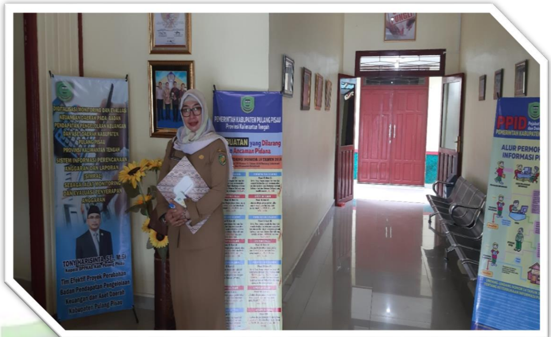
Foto 7 : Foto Peneliti Menunggu Antrian menghadap Kepala BPPKAD Kabupaten Pulang Pisau