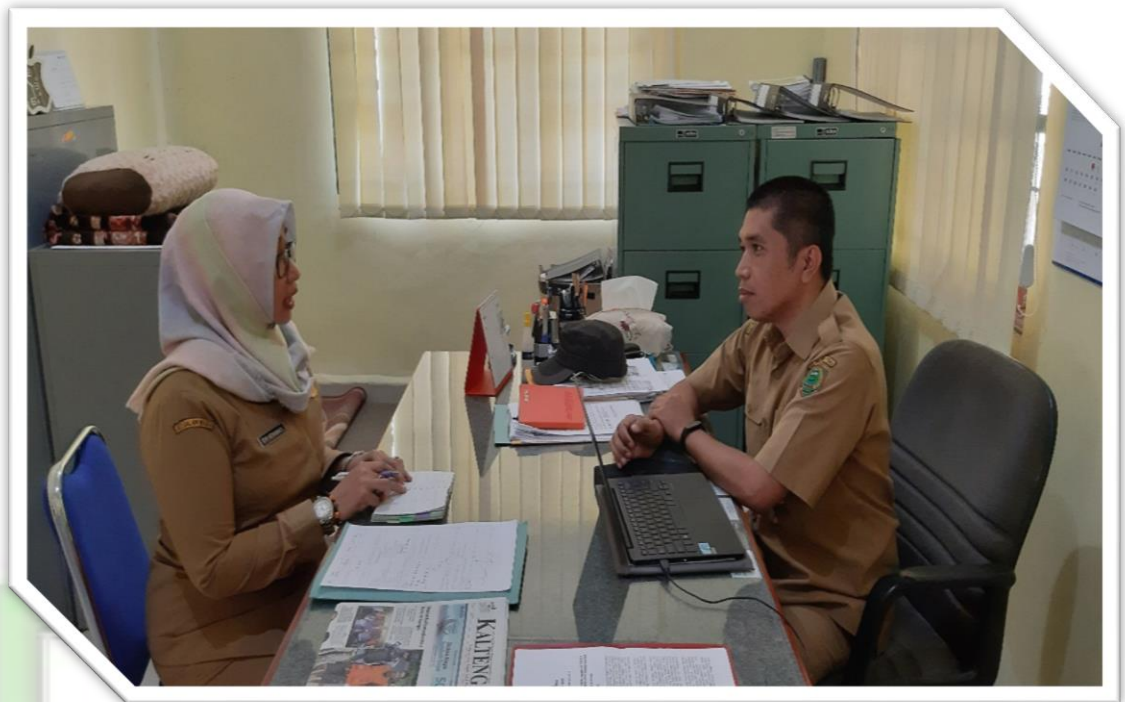
Foto 3 : Mewawancarai Kepala Bidang Perbendaharaan BPPKAD Kabupaten Pulang Pisau di Ruang Kerja Kepala Bidang Perbendaharaan