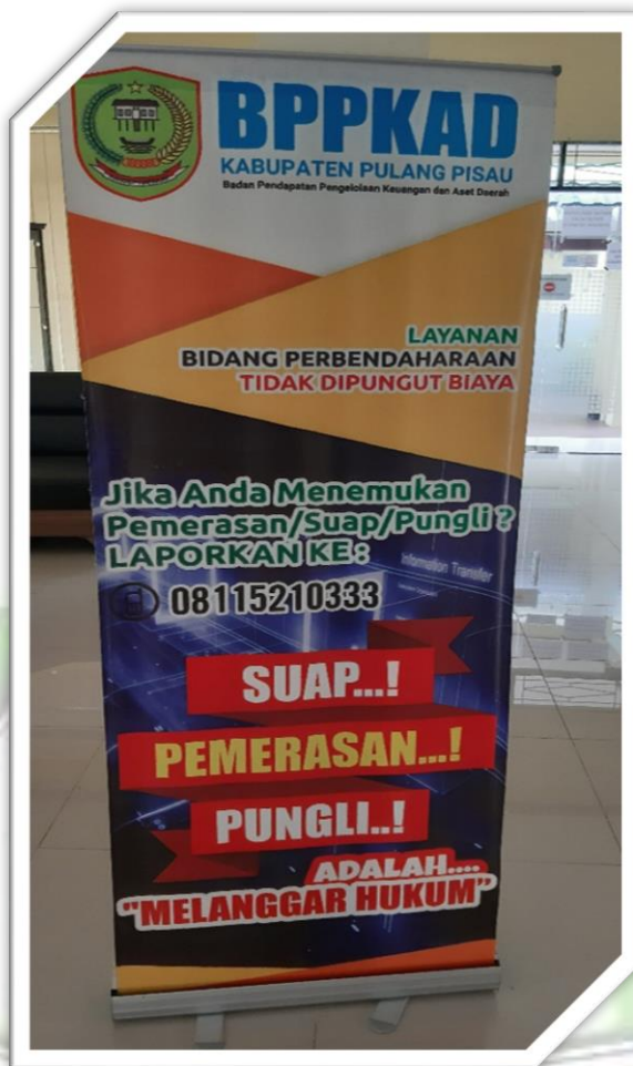
Foto 13 : Foto Banner Himbuan Pelayanan Bebas Suap, Pemerasan Pungutan Liar pada Bidang Perbendaharaan