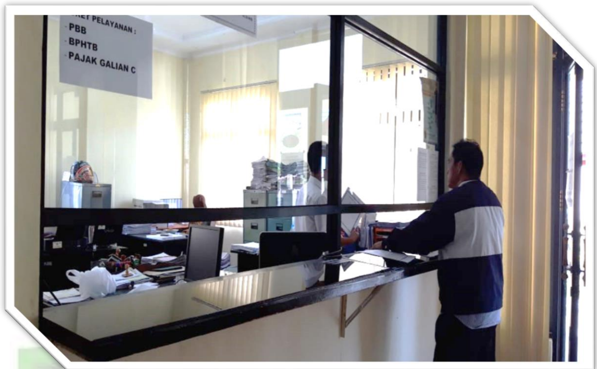
Foto 9 : Foto Loker Pelayanan Bidang Pendapatan BPPKAD Kabupaten Pulang Pisau