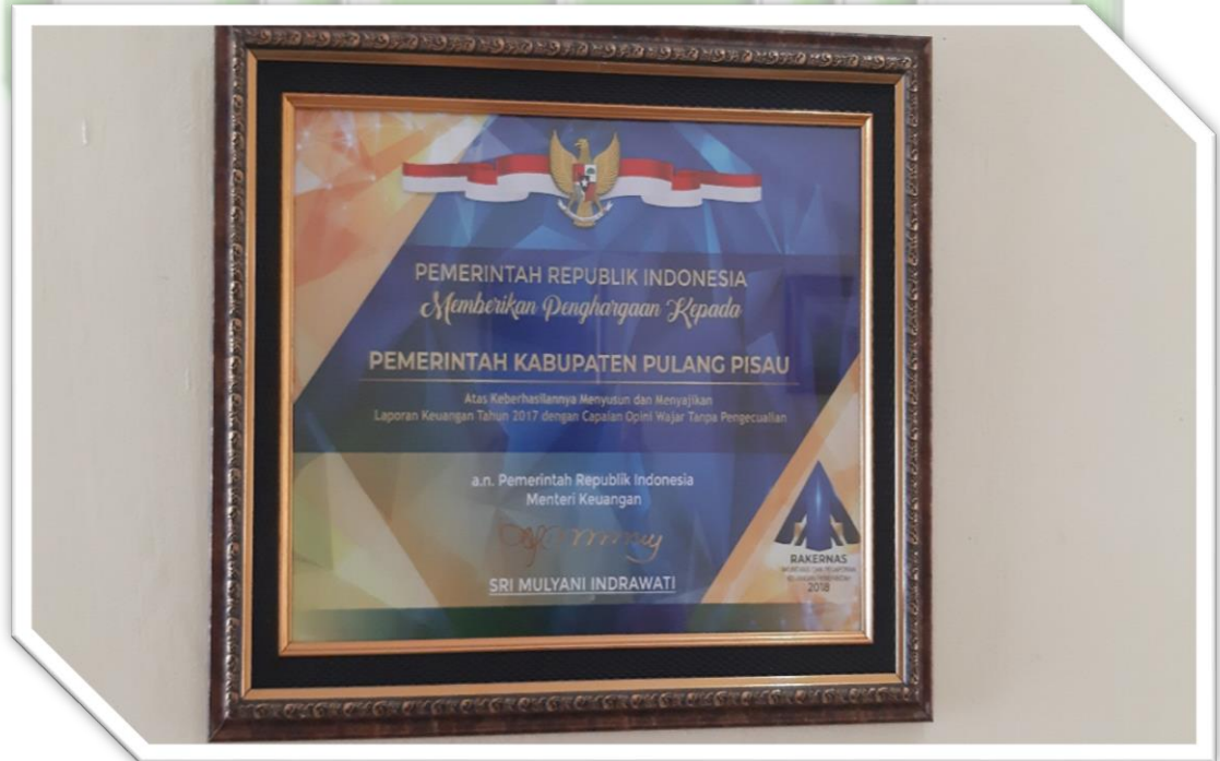
Foto 10 : Foto Piagam Penghargaan Menteri Keuangan RI kepada Pemerintah Kabupaten Pulang Pisau meraih Opini Wajar Tanpa Pengecualian atas LKPD Tahun 2017