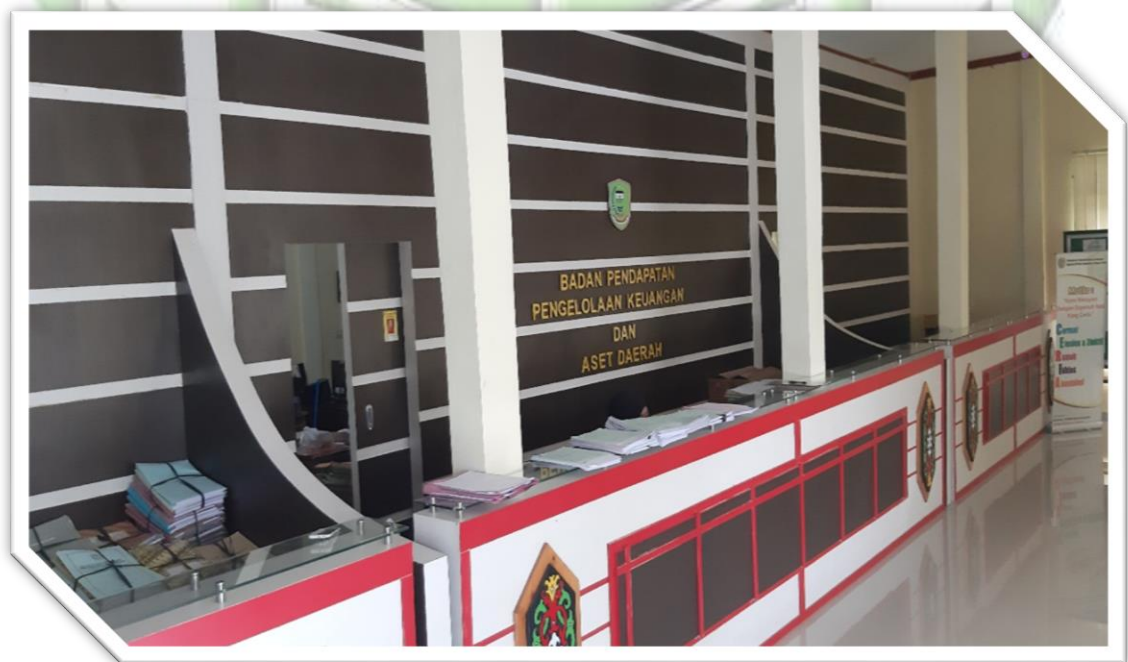
Foto 16 : Foto Loker Pelayanan Bidang Perbendaharaan BPPKAD Kabupaten Pulang Pisau