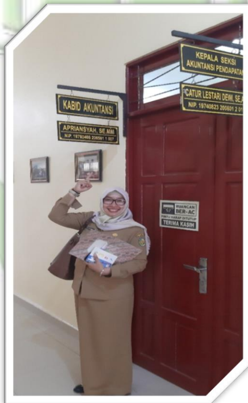
Foto 8 : Foto Peneliti di depan Ruangan Kepala Bidang Akuntansi BPPKAD Kabupaten Pulang Pisau