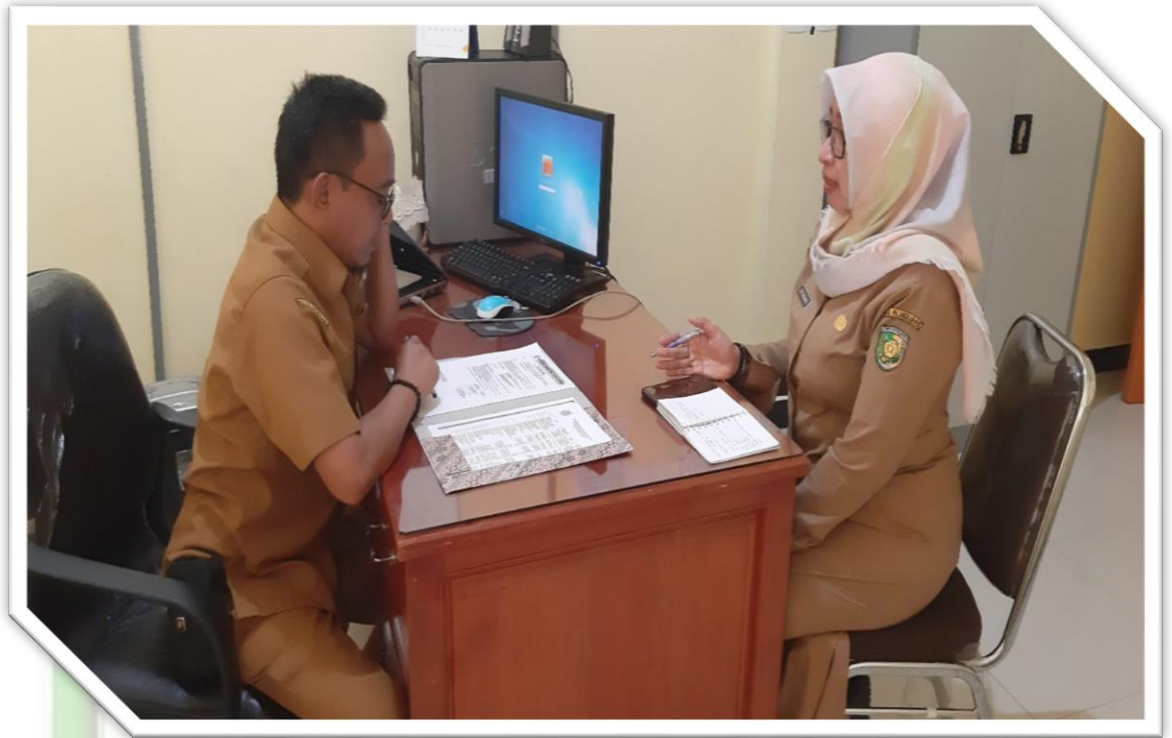
Foto 5 : Mewawancarai Kepala Bidang Anggaran BPPKAD Kabupaten Pulang Pisau di Ruang Kerja Kepala Bidang Anggaran