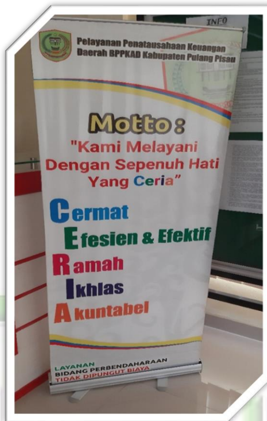
Foto 15 : Foto Banner Motto Pelayanan Penatausahaan Bidang Perbendaharaan