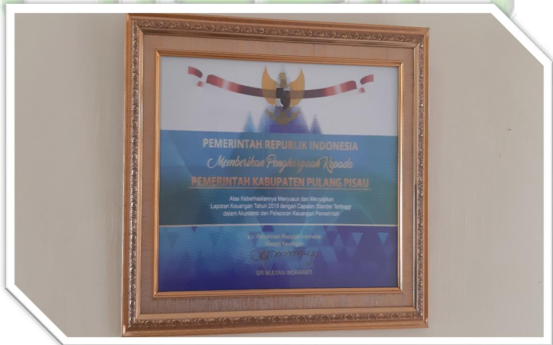
Foto 12 : Foto Piagam Penghargaan Menteri Keuangan RI kepada Pemerintah Kabupaten Pulang Pisau meraih Opini Wajar Tanpa Pengecualian atas LKPD Tahun 2015