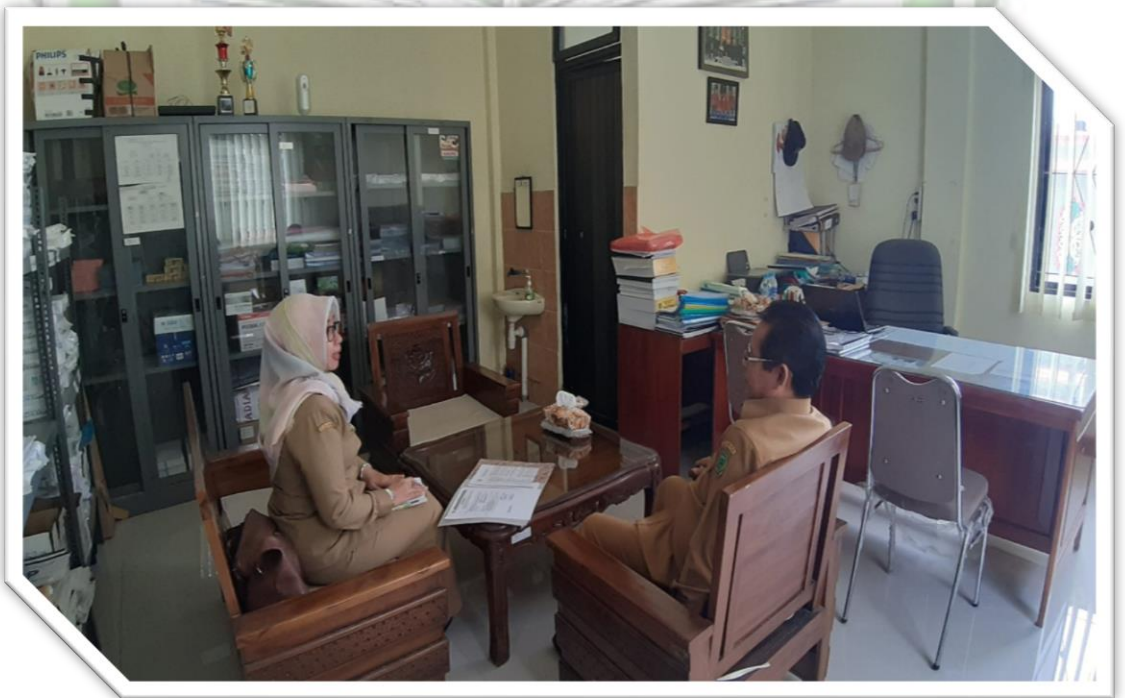
Foto 4 : Mewawancarai Kepala Bidang Pendapatan BPPKAD Kabupaten Pulang Pisau di Ruang Kerja Kepala Bidang Pendapatan