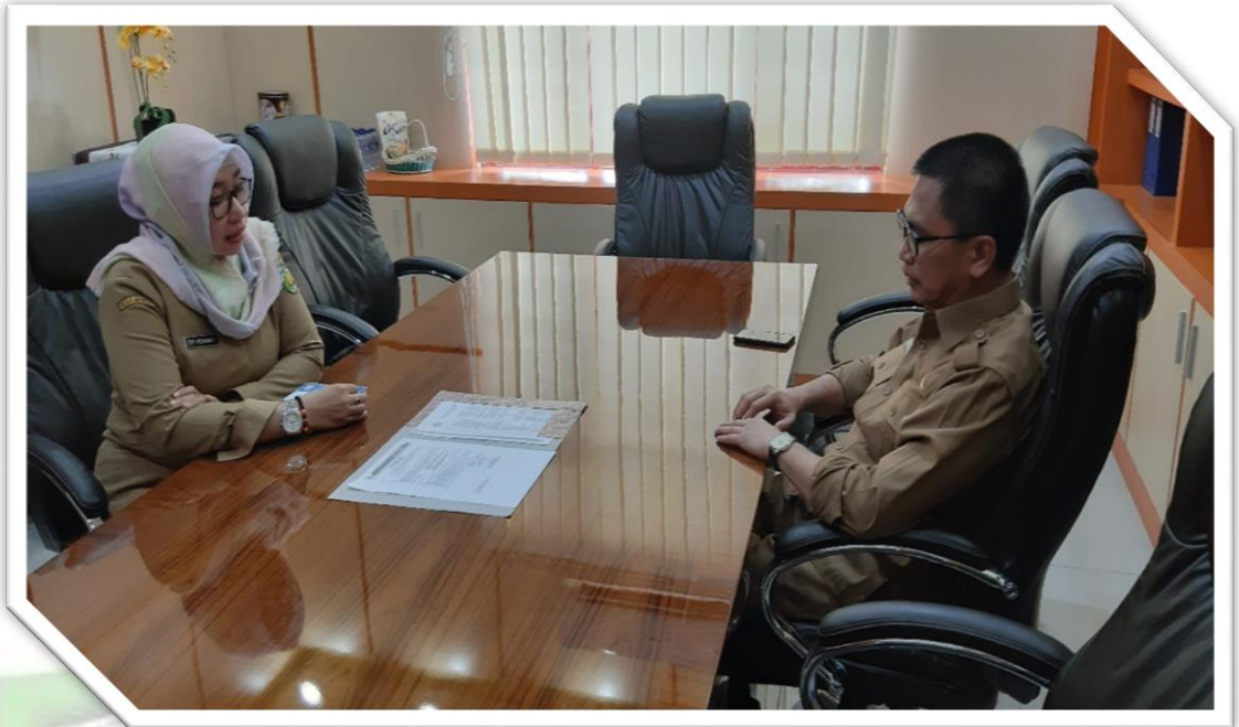
Foto 1 : Mewawancarai Kepala BPPKAD Kabupaten Pulang Pisau di Ruang Kerja Kepala BPPKAD