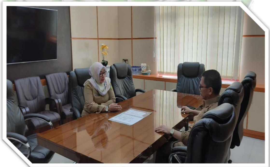
Foto 2 : Mewawancarai Kepala BPPKAD Kabupaten Pulang Pisau di Ruang Kerja Kepala BPPKAD