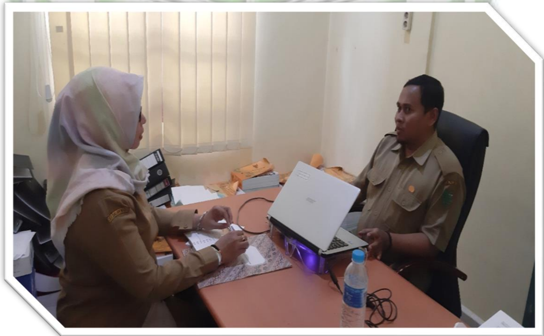
Foto 6 : Mewawancarai Kepala Bidang Akuntansi BPPKAD Kabupaten Pulang Pisau di Ruang Kerja Kepala Bidang Akuntansi