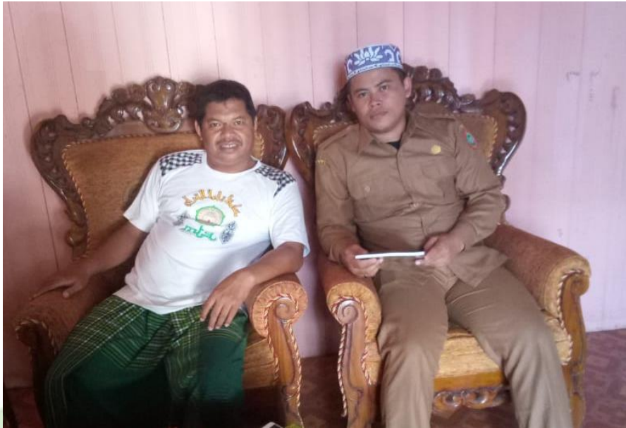
Photo wawancara dengan Bapak M selaku Pengawas PAI SMA/SMP Katingan Hilir