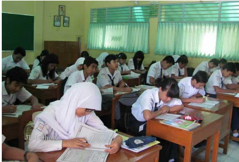
Kegiatan Pembelajaran PAI oleh guru A di SMPN 2 Katingan Hilir