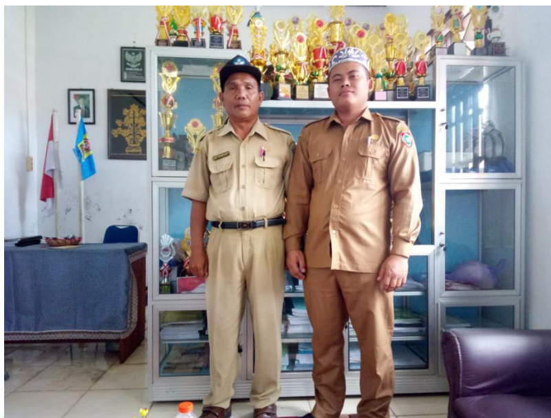
Photo wawancara dengan Bapak ... selaku Kepala SMPN 2 Katingan Hilir