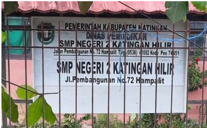
SMPN 2 Katingan Hilir