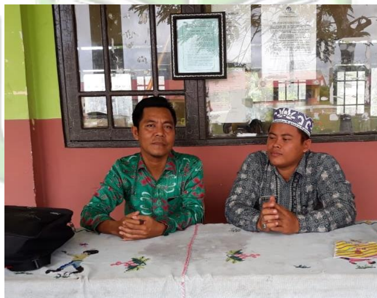
Photo wawancara dengan Bapak A selaku guru PAI bersertifikasi di SMPN 2 Katingan Hilir