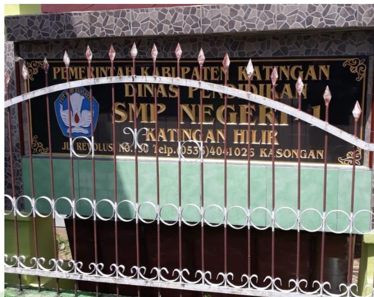
SMPN 1 Katingan Hilir