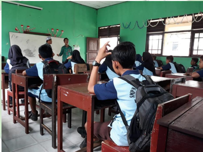
Photo Perkenalan Dengan Siswa Kelas VII di SMPN 2 Katingan Hilir