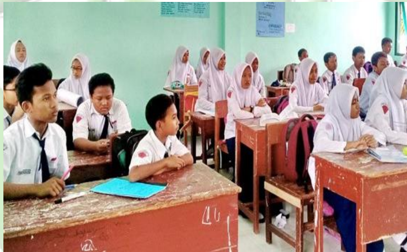
Kegiatan Pembelajaran PAI oleh guru R di SMPN 1 Katingan Hilir