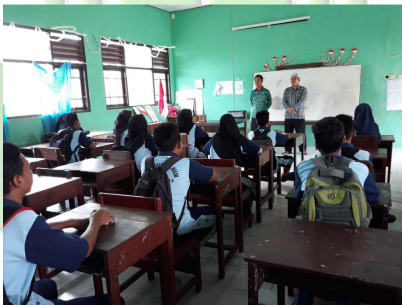
Photo Perkenalan Dengan Siswa Kelas VII di SMPN 2 Katingan Hilir