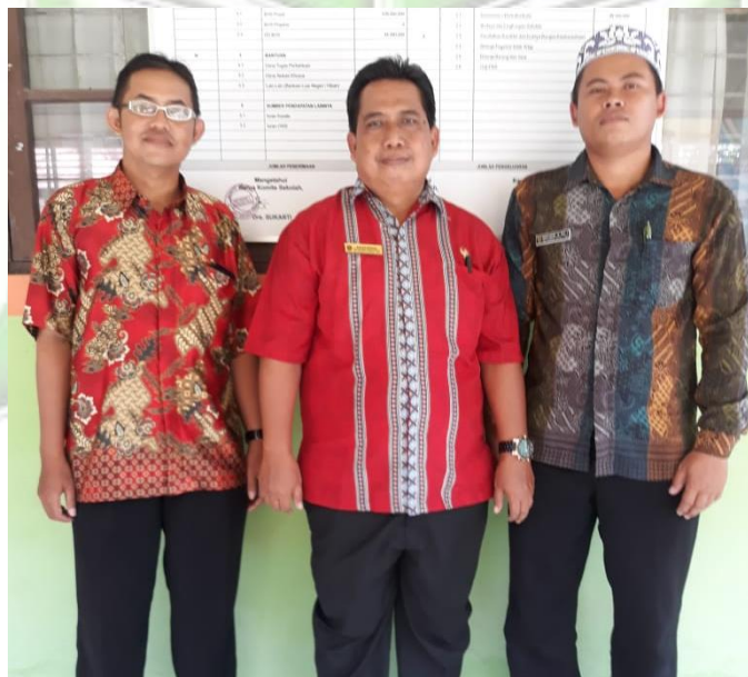
Photo wawancara dengan Bapak S (Tengah) selaku Kepala SMPN 1 Katingan Hilir dan Bapak R selaku guru PAI bersertifikasi di SMPN 1 Katingan Hilir